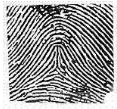
Arco a tenda